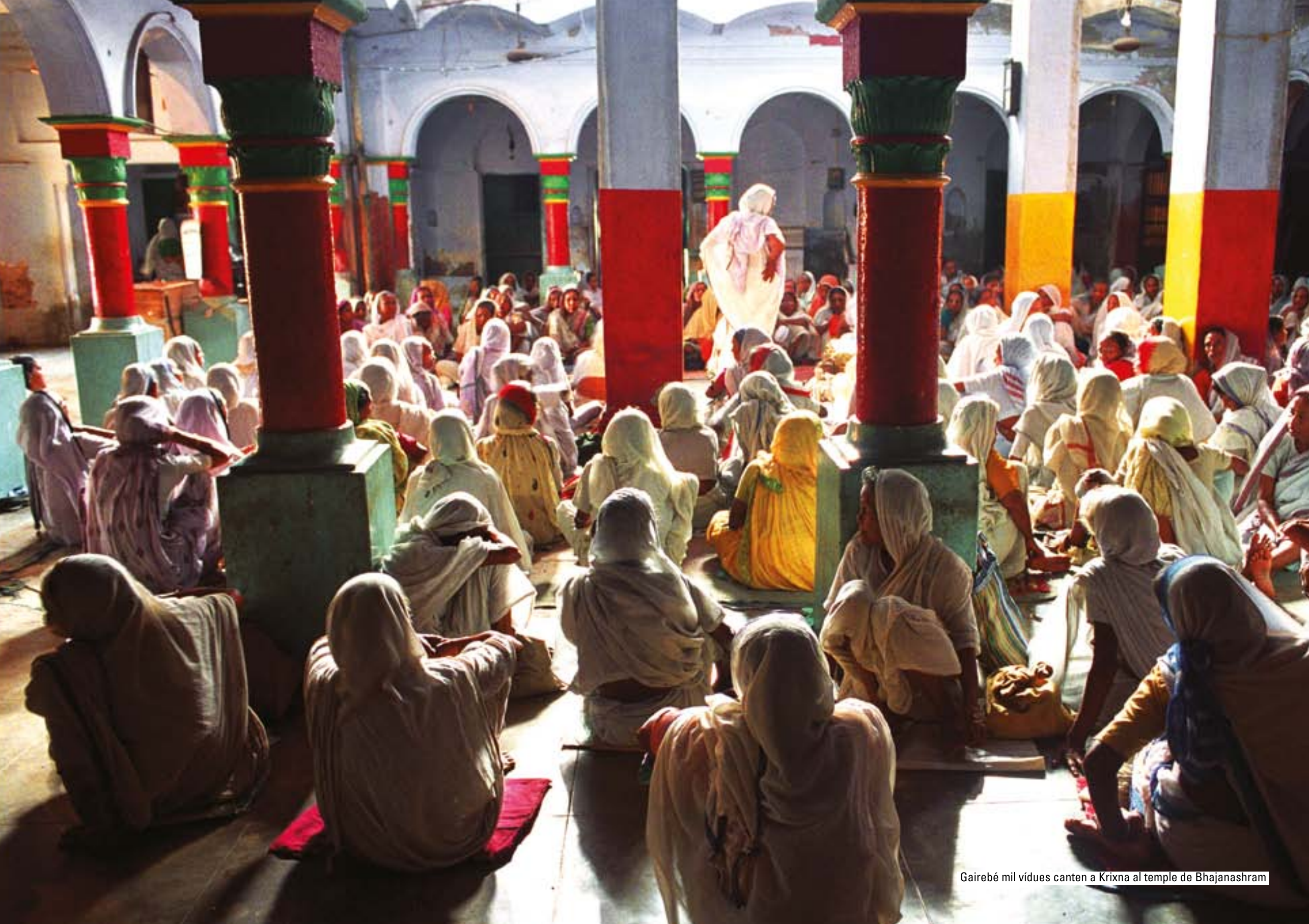
Gairebé mil vídues canten a Krixna al temple de Bhajanashram