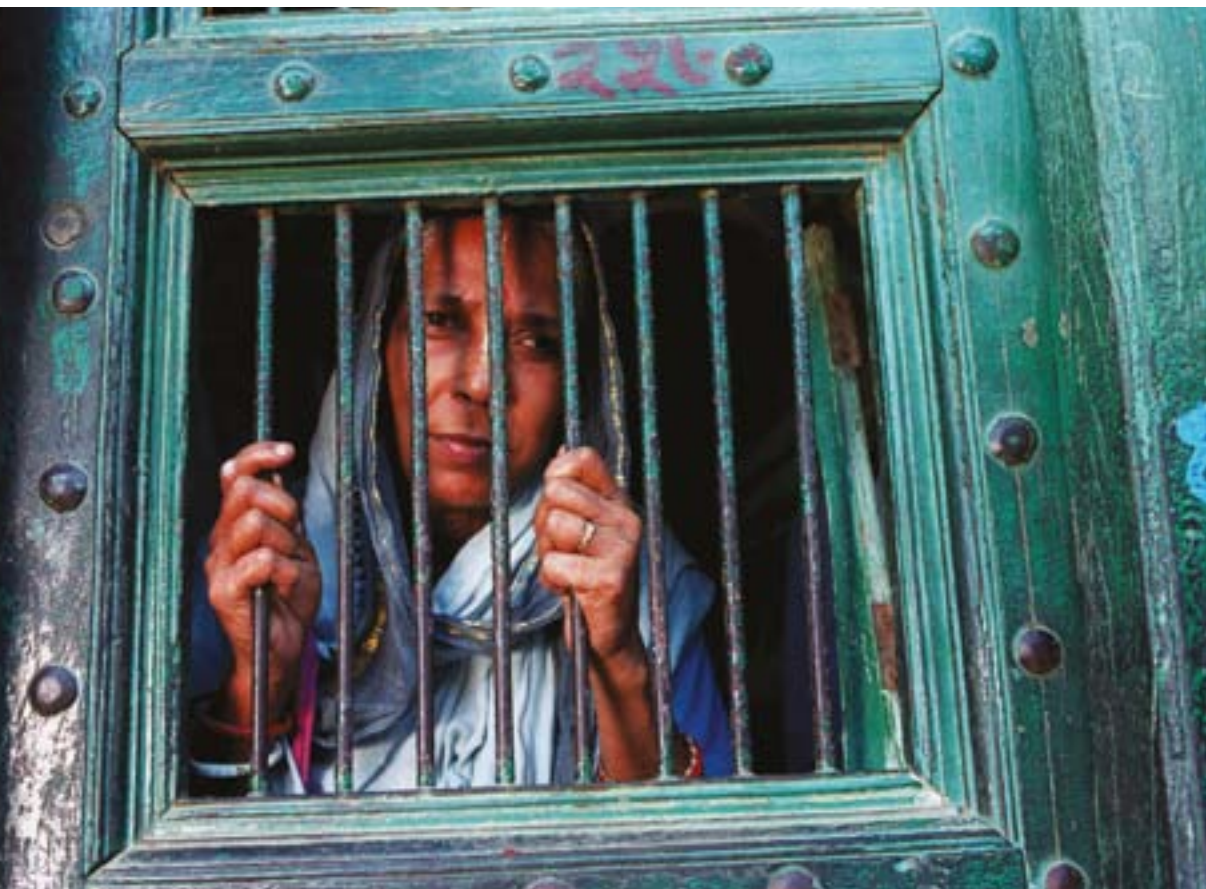
▲ Temple de Bhajanashram