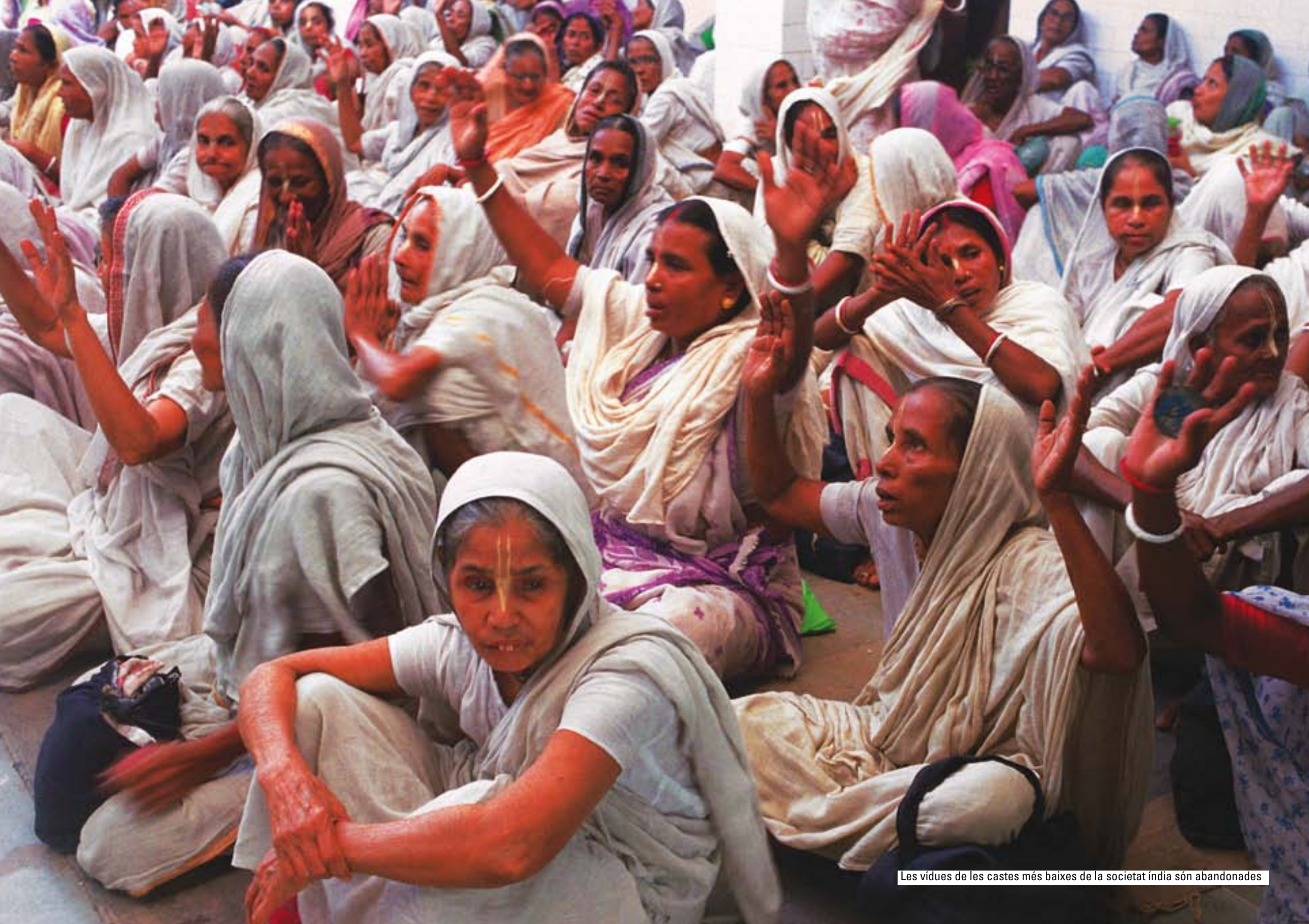
Les vides de les castes més baixes de la societat índia són abandonades