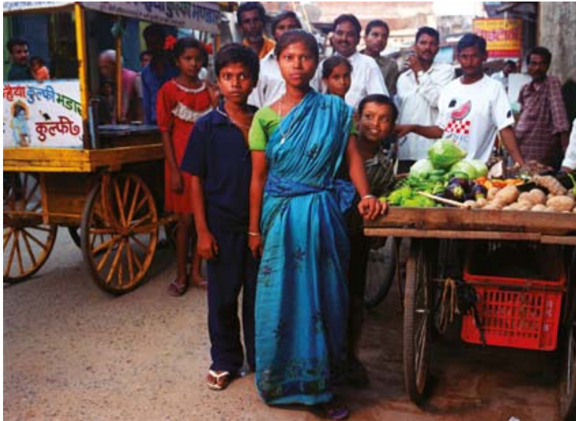
▲ Nilam va heretar del seu marit el carret de verdures