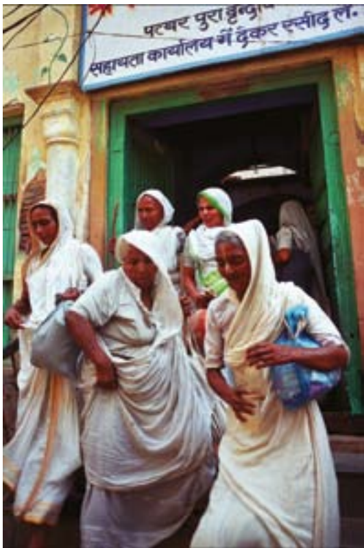
◀ Temple de Bhajanashram. Per 8 hores de càntics reben una rúpia